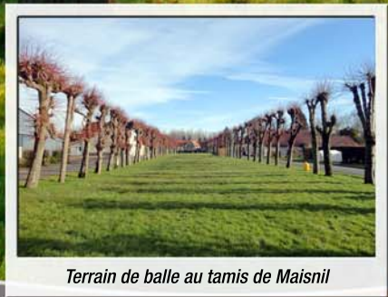
Terrain de balle au tamis de Maisnil