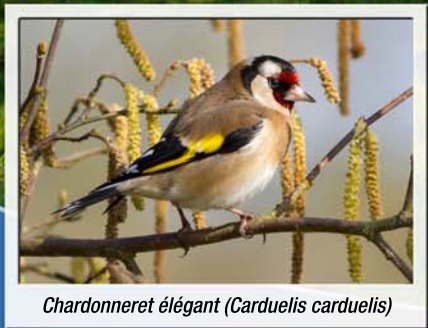
Chardonneret élégant ( Carduelis carduelis )