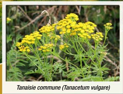
Tanaisie commune ( Tanacetum vulgare )